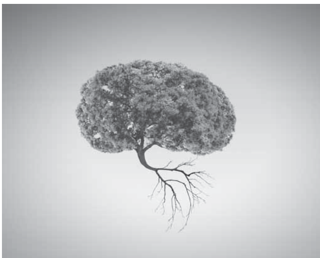
Die Fachstelle Senioren und Inklusion im Landratsamt plant die Einrichtung eines neuen „Helferkreises für MeHr Leben“.

Der Schlaganfall ist mit 270.000 Betroffenen jährlich eine der großen Volkskrankheiten in Deutschland. Aufgrund der demographischen Entwicklung wird die Zahl weiter steigen. Der Schlaganfall ist auch der häufigste Grund für Behinderungen im Erwachsenenalter. Fast zwei Drittel der Überlebenden sind dauerhaft auf Unterstützung, Therapie, Hilfsmittel oder Pflege angewiesen. Eine Schädel – Hirn – Verletzung hat ähnliche Auswirkungen im Alltag für die Betroffenen. In Deutschland geht man von bis zu 400 Schädel-Hirnverletzungen pro 100.000 Einwohner pro Jahr aus. Etwa 180 von 100.000 Schädel-Hirntraumen sind dabei so schwer, dass hier langfristige Schäden zu erwarten sind und dass mehr als 4.000 Patienten jedes Jahr als dauerhaft Geschädigte mit schweren Verletzungen zu Langzeitpflegefällen werden.