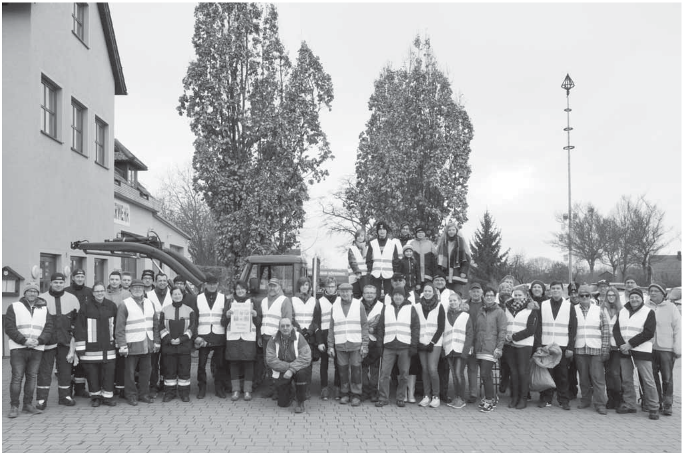
Treffpunkt für die 14. vom Landkreis Regensburg unterstützte Rama Dama - Aktion der Köferinger Vereine war um 9 Uhr auf dem Platz vor Gemeindezentrum und Feuerwehrgerätehaus.

(Presserechtlich verantwortlich für Text und Bild ist der Autor Dr. Gerhard Giegerich).